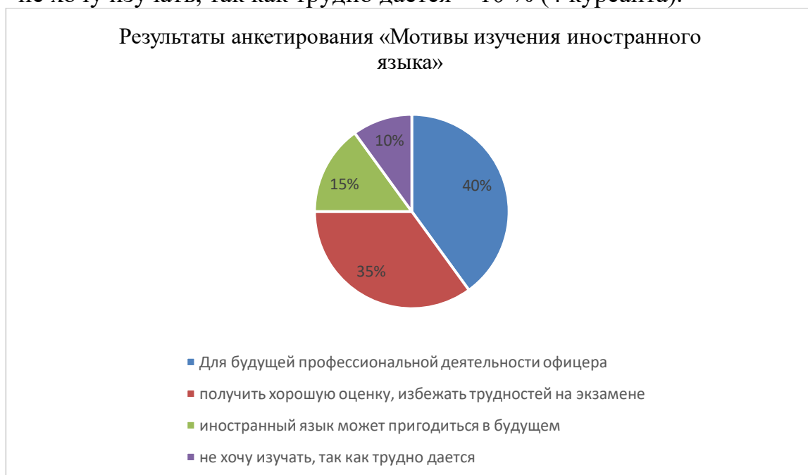
Рисунок 1 - результаты анкетирования «Мотивы изучения иностранного языка»

Далее для определения исходных данных коммуникативно - поведенческого показателя мы использовали метод наблюдения во время учебного процесса, во время проведения учебных занятий.