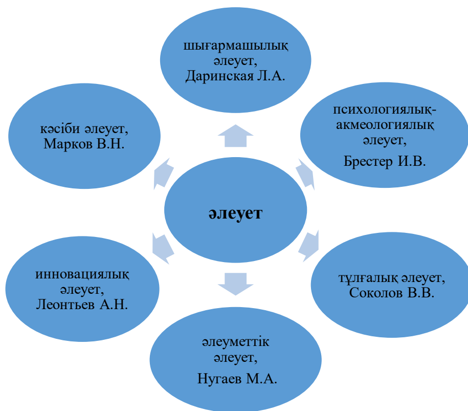
Сурет -2 Ғылыми зерттеулердегі «әлеует» түрлері

Суреттегі аталған әлеует түрлеріне жеке тоқталсақ: