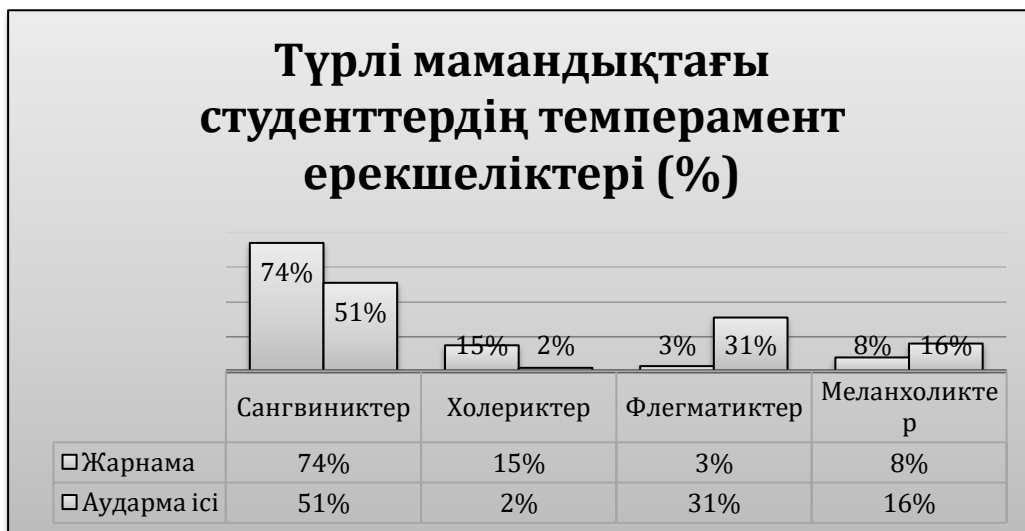
2-сурет. Түрлі мамандықтағы студенттердің темперамент типтері туралы мәліметтер

Зерттелінушілерге темперамент түрін анықтау үшін А.Беловтың [2,466-469] әдістемесі берілді. Онда психологиялық төлқұжаттың төрт түрінен жеке ерекшеліктеріне сәйкес ең қолайлы мәлім-демені тағайындау арқылы өздеріне қажетті жауап нұсқасын таңдап, плюс таңбасымен белгілейді. Төрт төлқұжаттың әрқайсысы үшін темперамент түрлеріне тән жиырма сипаттама берілгенін және төлқұжаттағы мәлімдемелердің ең көп санын қою кезінде зерттелінушіге тән темперамент түрі анықталатынын атап өту маңызды.