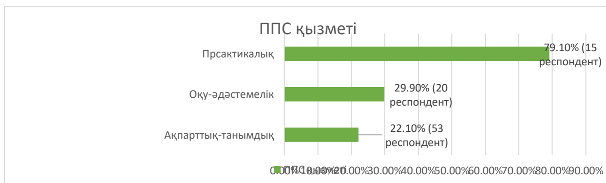
Диаграмма 7. ППС қызметі

Жалпы білім беру мектептеріндегі психологиялық-педагогикалық сүйемелдеу кабинеттері түрлі қызмет атқарады. Олар ақпараттық-танымдық, басқа пән мұғалімдеріне оқу-әдістемелік және ерекше білім алу қажеттіліктері бар балаларға білім беру мен тәрбиелеу қызметімен айналысады. Сауалнама барысында ППС кабинеттері көбінесе практикалық қызмет түрлерін, яғни ерекше білім алу қажеттіліктері бар балаларға білім беру мен тәрбиелеу қызметмен айналысатынын көрсетті.