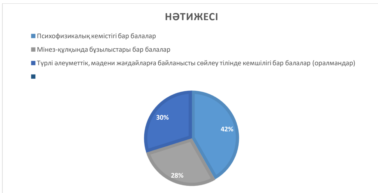
Диаграмма 3. Мамандар жұмыс жасайтын оқушылар категориясы

Нормативтік-құқықтық блок бойынша сұрақтар