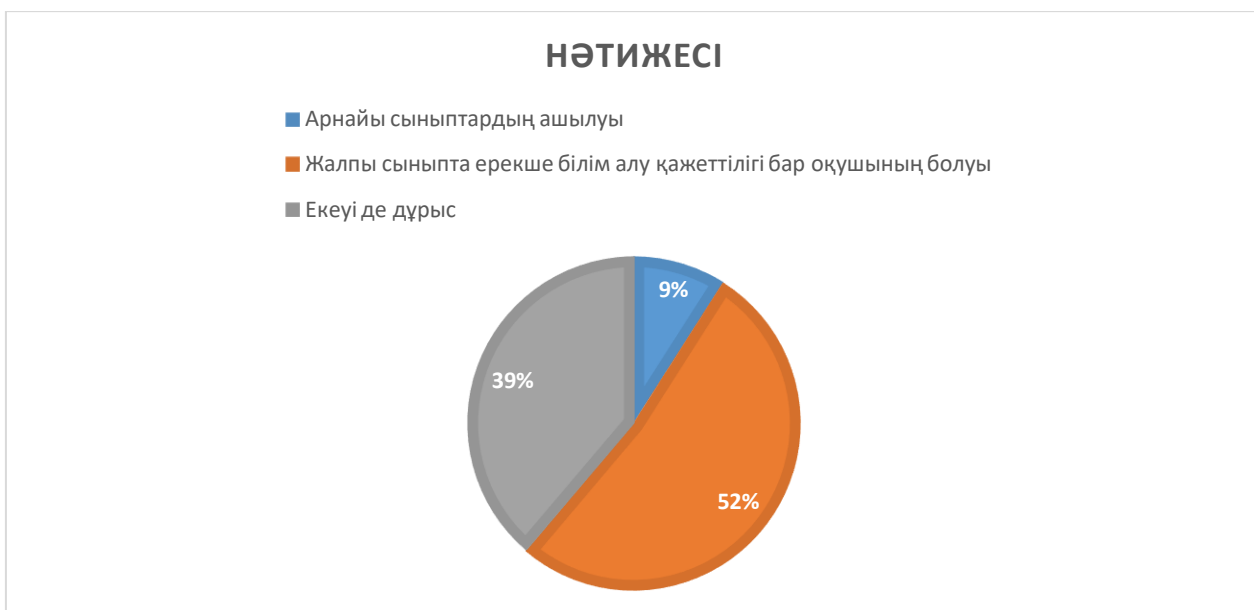
Диаграмма 1. Арнайы сынып саны

Сұрақ 4. Ерекше білім беруді қажет ететін адамдар (балалар) – тиісті деңгейде білім алу және қосымша білім алу үшін арнаулы жағдайларға тұрақты немесе уақытша қажеттілік көріп жүрген адамдар (балалар). Сіз осы ұғыммен қанишалықты деңгейде келісесіз? (шкала бойынша бағалаңыз мұнда 1 мүлдем келіспеймін, 2 келіспеймін, 3 не деп жауап берерімді білмеймін, 4 келісемін, 5 толығымен келісемін).