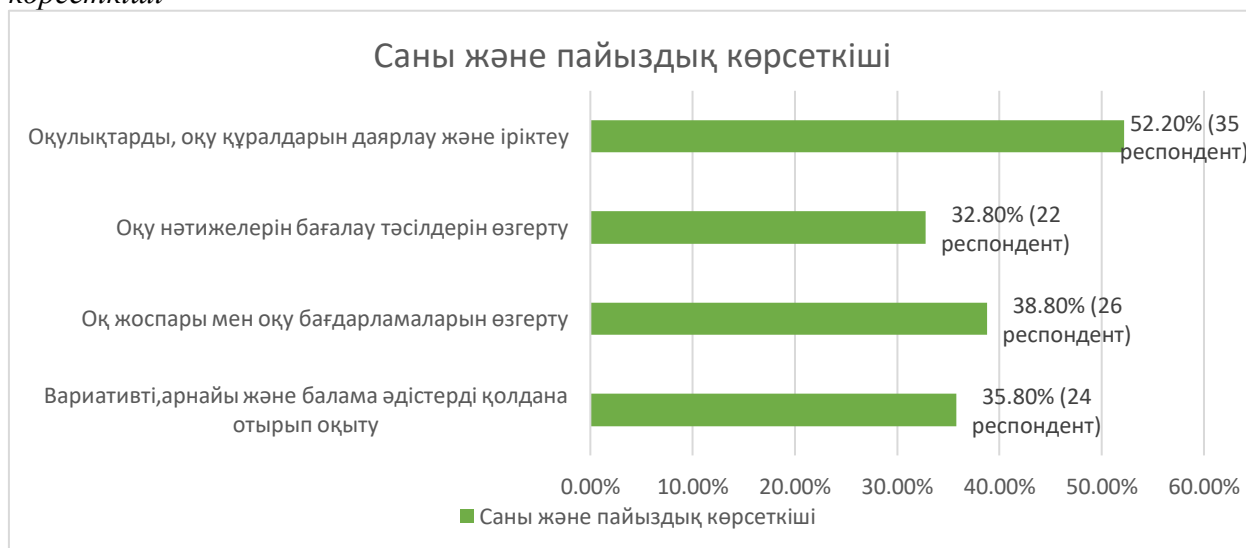
Диаграмма 5. Ерекше білім беру қажеттіліктерін қанағаттандырудың пайыздық көрсеткіші

Диаграмма 4. Ерекше білім беру қажеттіліктерін қанағаттандырудың пайыздық көрсеткіші