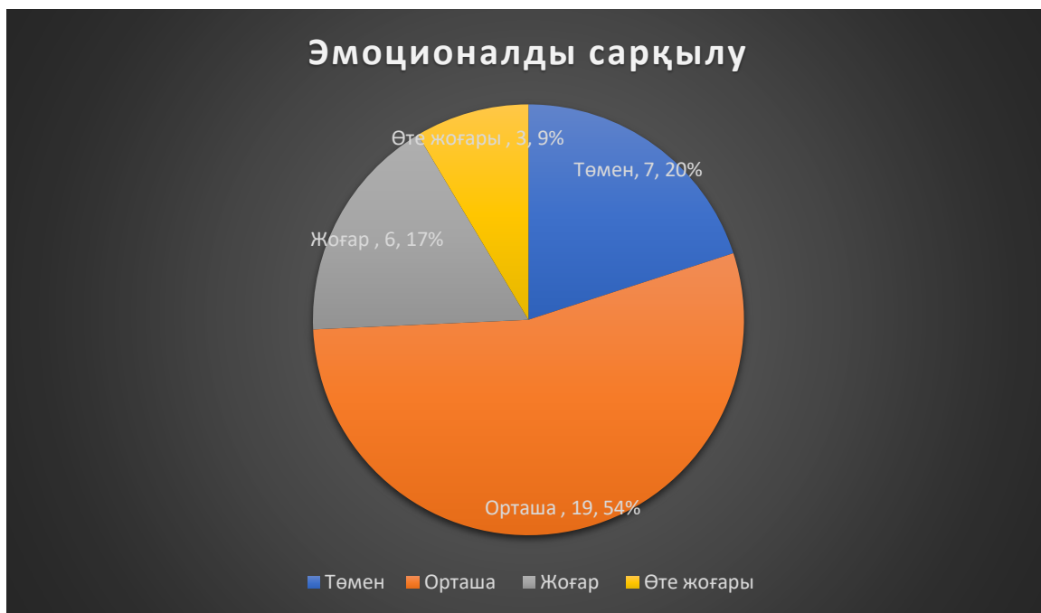
Сурет - 1. Эмоционалды сарқылу деңгейі

Сыналушылардың жауаптарын өңдеу барысында ең жоғары пайыздық үлесті эмоционалды сарқылудың орташа деңгейі көрсетті 19 (54%) қызметкер, өте жоғары деңгейде 3 (9%), жоғары деңгей 6 (17%) және төмен деңгей 7 (20%) сыналушыда анықталды.