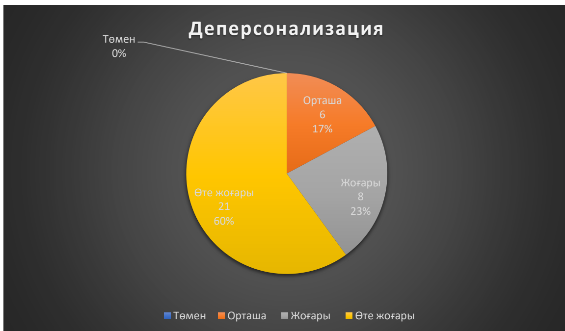
Сурет - 2. Деперсонализация деңгейі

Кәсіби жетістіктердің төмендеуі адамның жеке тұлға ретінде және маман ретінде өзі-өзі қанағаттану дәрежесін көрсетеді. №14 қалалық емхананың қызметкерлеріне жүргізілген әдістеменің нәтижесінде кәсіби жетістіктердің төмендеуі құрамдас бөлігі келесі нәтижені көрсетті: төмен деңгейі – 17 қызметкерде (48%), орташа деңгей 13 (37%), сонымен қоса жоғары деңгей 3 (9%) және кәсіби жетістіктердің төмендеуі бойынша өте жоғары деңгей 2 (6%) қызметкерде анықталды.