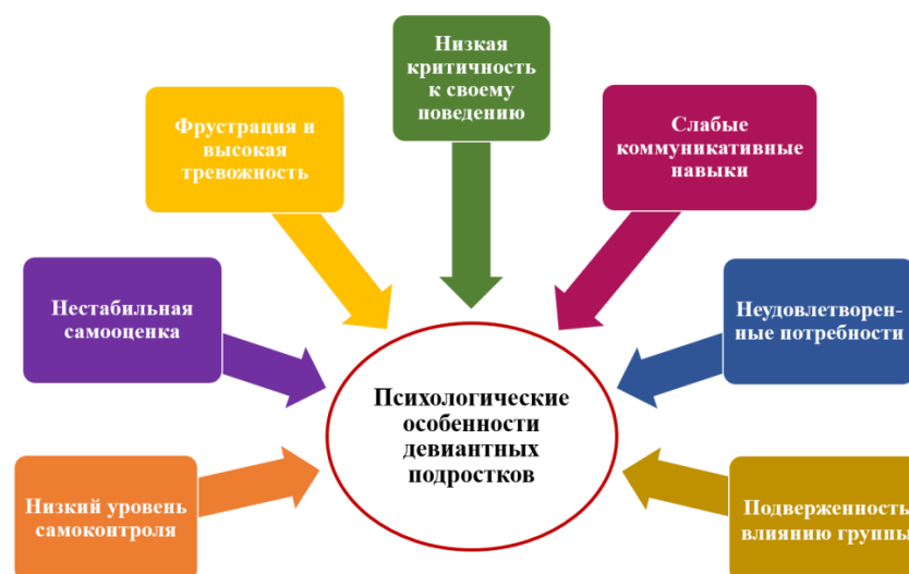
Рисунок 2. Психологические особенности девиантных подростков

Вышеперечисленные психологические особенности подростков с девиантным поведением схематично представлены на рисунке 2.