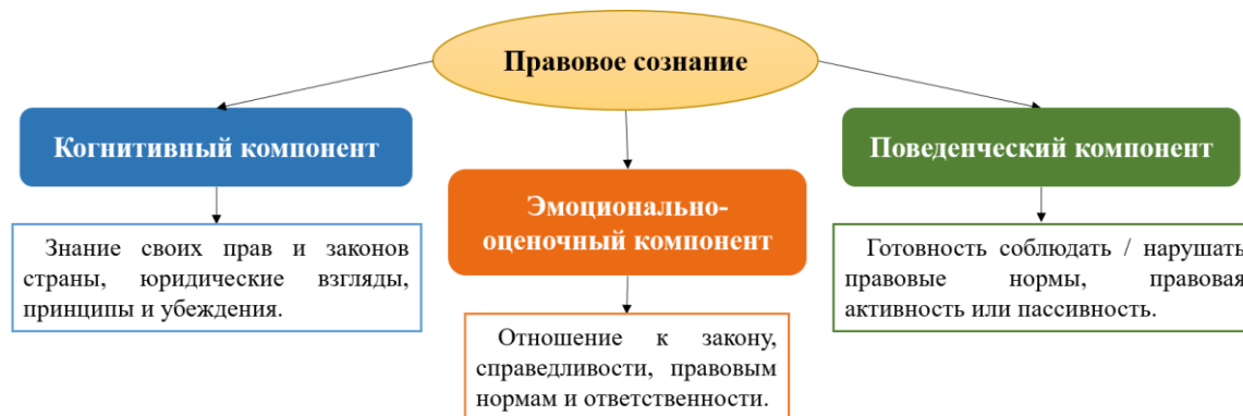
Рисунок 1. Компоненты правового сознания

По данным структурам правового сознания составлена схема для обобщения и визуализации (см. Рисунок 1).