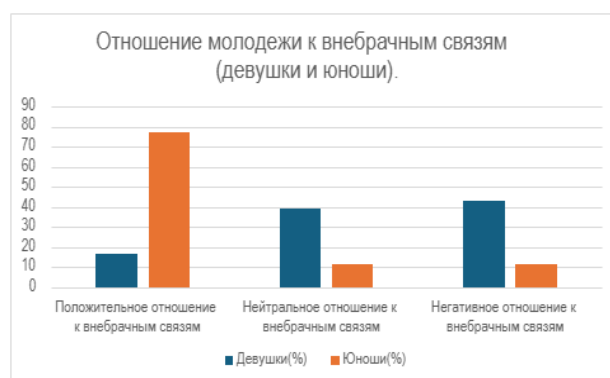
Рисунок 2. - Отношение молодежи к внебрачным связям

Положительное отношение к взаимоотношениям без регистрации брака – 77,2% респондентов-юношей; нейтральное отношение – 11,4% (рисунок 2); отрицательное отношение – 11,4%; наличие опыта открытых отношений – 94,6%; не имеют опыта подобных отношений – 5,4% (рисунок 3). У юношей преобладает положительные оценки к открытым отношениям без регистрации брака и большинство из них имеет опыт подобных взаимоотношений. Можно констатировать значительное смещение в ценностных установках в сторону принятия альтернативных форм взаимоотношений, отличающихся от традиционного института брака. Амбивалентность (противоречивость) в ценностных установках и поведении участников исследования 43,4% среди девушек; и 16,2% среди юношей, т.е. несмотря на негативные оценки взаимоотношений без регистрации брака имеют подобный опыт. Такой эффект возможен ввиду рационализации и принятия ранее неприемлемого опыта, что более выражено у девушек, которые испытывают большее давление в вопросах морали.