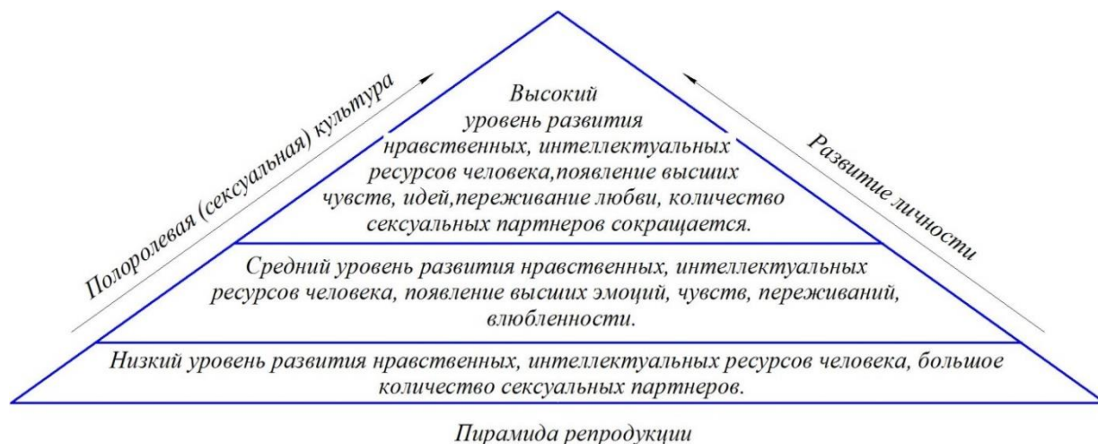
Рисунок 1. - Пирамида репродукции

Согласно предложенной концепции, низкий уровень репродуктивной культуры может коррелировать с повышенным числом половых партнеров, сниженным уровнем ответственности и готовности к родительству. Основание пирамиды соответствует низкому уровню культуры и широкому спектру половых контактов. Вершина пирамиды отражает высокую степень осознанности, ответственности и готовности к родительству с индивидуализированным или персонализированным партнером.