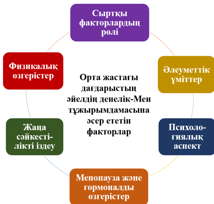
Сурет 1 – Орта жастағы дағдарыстың әйелдердің денелік-Мен имиджіне негізгі әсері

Сонымен, жоғарыда берілген орта жастағы дағдарыс кезіндегі құбылыстар әйелдің денесіне және Мен-тұжырымдамасына әсер етеді. Олар Сурет 1-де көрсетілген.