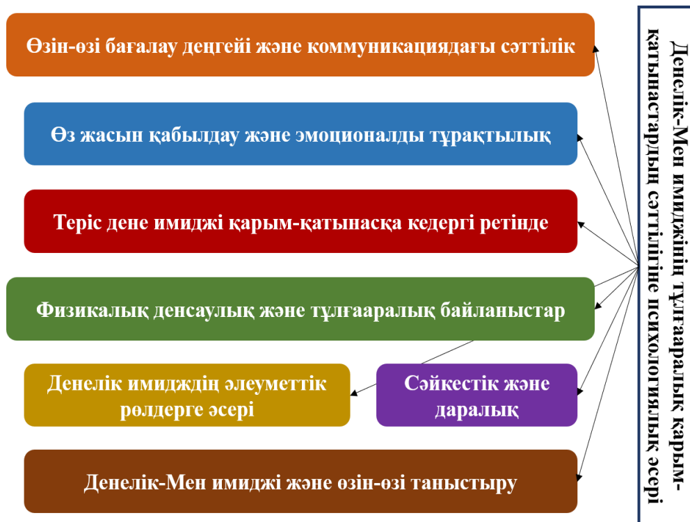
Сурет 2 - Денелік-Мен имиджінің тұлғааралық қарым-қатынастардың сәттілігіне психологиялық әсері

Сызбада берілген аспектілер Денелік-Мен имиджі және тұлғааралық қарым-қатынастардың сәттілігінің өзара байланысын когнитивті, перцептивті, эмоционалды және мінез-құлық жақтан көрсетеді.