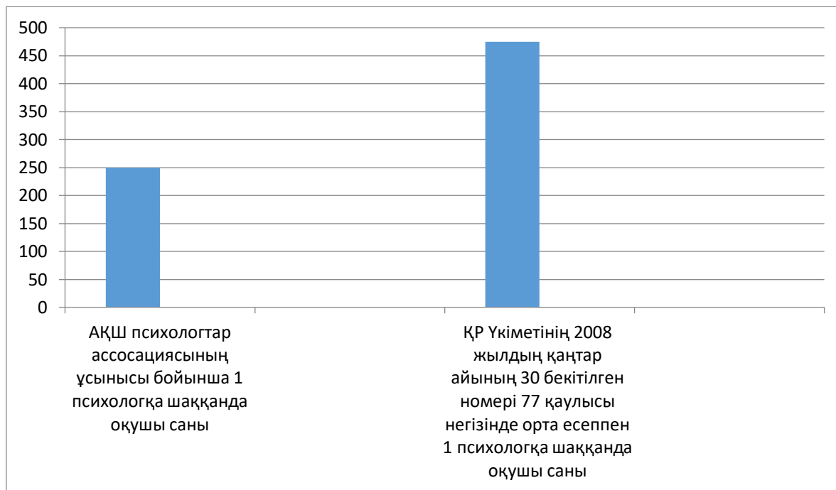
Сурет 2. АҚШ психологтар ассоциациясының ұсынысы бойынша және Үкіметтің 2008 жылдың қаңтар айының 30 Қазақстан Республикасы деңгейінде енгізілген №77 Қаулысын басшылыққа ала отырып есептегендегі 1 психологқа шаққанда оқушы санының көрсеткіші

Ал енді осы тұста Қазақстан мен Үлкен жетілік елдерінің құрамына кіретін АҚШ орта білім беру ұйымдарының психолог мамандармен қамтамасыз етілу барысымен салыстырудың реті келіп тұр. АҚШ психологтар ассоциациясының ұсынысы бойынша 250 оқушымен 1 психолог жұмыс жасаса ол тиімді болмақ деп көрсетіледі. Қазақстандық орта деңгейде тәрбие мен білім беретін орындарда психологиялық жұмыстарға ұйымдастыру жағдайында, мемлекетіміздің 2008 жылдың қаңтар айының 30 бекітілген номері 77 қаулыны басшылыққа ала отырып. Орта есеппен бір мектепте 19 сынып бар делік, онда әр сыныпта шамамен 25 оқушыдан деп есептер болсақ. Шамамен бір педагог-психологқа 475 оқушыдан келетіндігін көруге болады. Бұл өз кезегінде екі елдің мектеп оқушыларының психологиялық қызмет көрсететін мамандармен қамтамасыз етілуінде, ерекшеліктің бар екендігін көрсетеді [9,10] (Сурет 2).