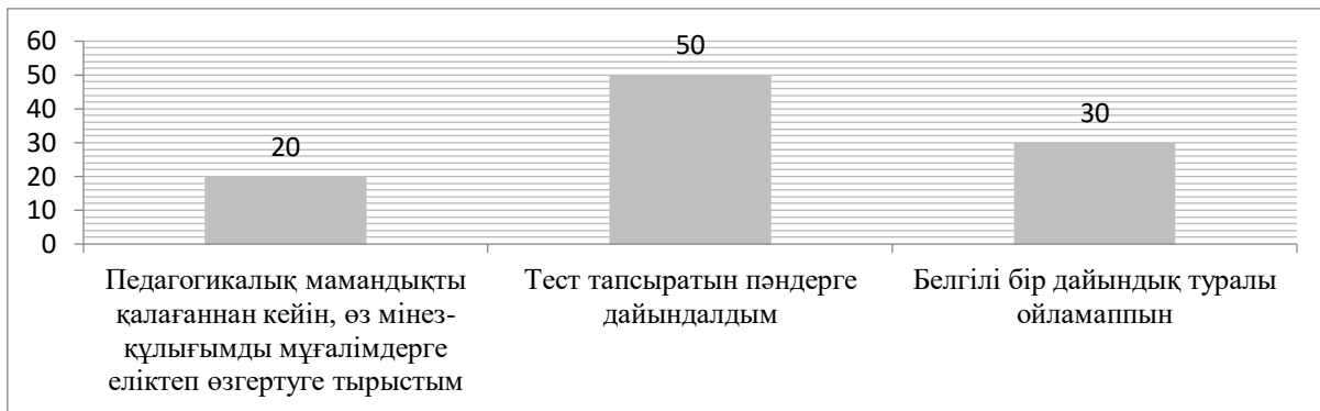
Сурет 2– Педагогикалық мамандыққа қалай дайындалдым?

Сауалнаманың екінші «Педагогикалық мамандыққа қалай дайындалдым?» сұрағына сыналушы-лардың 4 (20%) студент «Педагогикалық мамандықты қалағаннан кейін, өз мінез-құлығымды мұғалімдерге еліктеп өзгертуге тырыстым»; 10 (50%) студент «Тест тапсыратын пәндерге дайын-далдым»; 6 (30 %) студент «Белгілі бір дайындық туралы ойламаппын» деп жауап берді. Бұл сұрақта студенттердің педагогикалық мамандыққа деген қатынасын анықтау мүмкіндігін көреміз. Студент-тердің педагогикалық мамандықтың жауапкершілігінің жоғары екендігін сезіндіру бағытын айқындау маңызды.