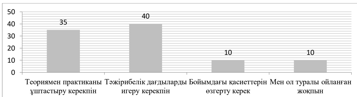
Сурет 4– Жоо-да оқу үдерісінде кәсіби дайын болу үшін неге қол жеткізуім қажет?

Төртінші сұрақ «Жоо-да оқу үдерісінде кәсіби дайын болу үшін неге қол жеткізуім қажет?» деген сұраққа 7 (35%) студент «Теориямен практиканы ұштастыру керекпін»; 8 (40%) студент «Тәжірибелік дағдыларды игеру керекпін» деп; 2-еуі (10%) «Бойымдағы қасиеттерін өзгерту керек»; 2-еуі (10%) «Мен ол туралы ойланған жоқпын» деп жауап берді. Студенттердің кәсіби білім алу барысында өзіне не қажет, қандай бағытта мамандануға болатындығын анықтауға мүмкіндік береді.